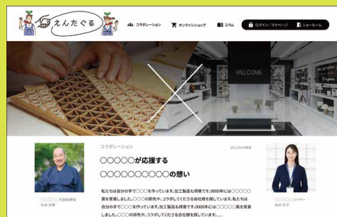
コラボレーションTOP画イメージ

“えんたぐる”に登録して、これまでに無い 業種や業態、商品同士のコラボレーションで 地域を盛り上げてみませんか？